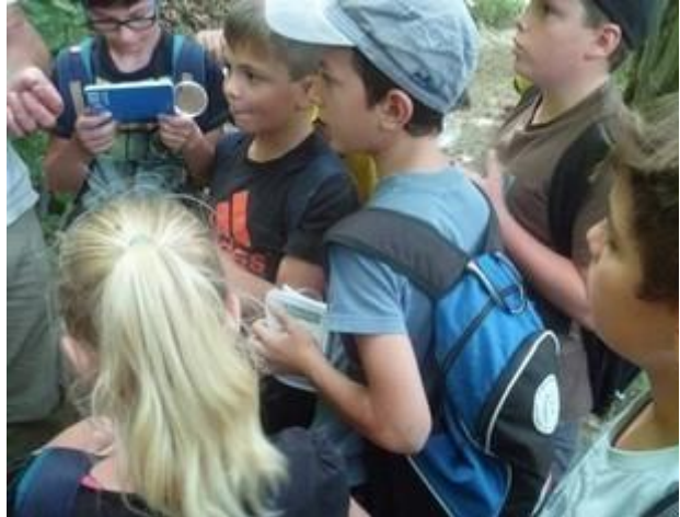
Stage nature 2017

Nous avons aussi organisé un stage de 3 jours avec des jeunes de 7 à 12 ans en pleine nature.