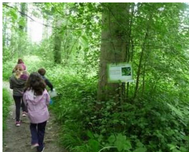
École de Jardin, rallye nature dans la forêt du Fouillet

• les communes de Vénissieux, de Jardin et d'Eyzin-Pinet