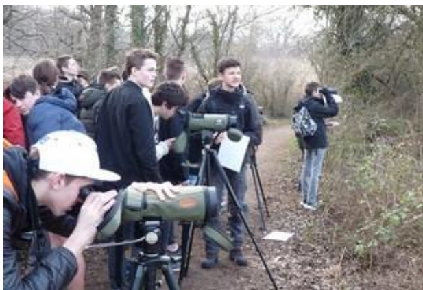
Animation à l'étang de St Bonnet

Ces animations se répartissent ainsi : 85 en écoles maternelles, 33 en écoles élémentaires, 2 en collèges, 5 en lycées, 3 en centres de loisirs, 1 en MFR et 7 auprès du grand public.