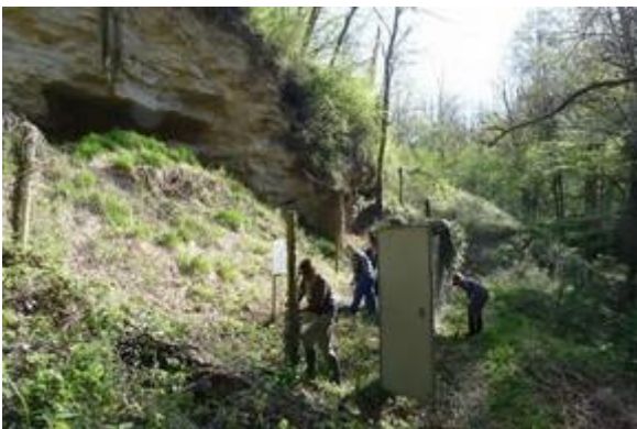
Chantier d'entretien de la Vesciat