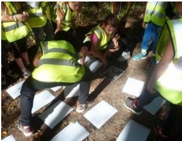
TAP champignon à Bellegarde-Poussieu

Au total, 104 ateliers ont ainsi été animés.