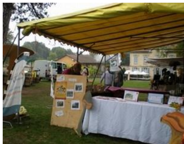
Stand fête pomme de pain 2017